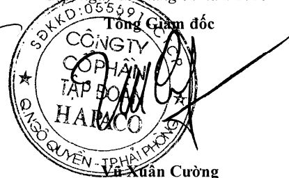
Vũ Xuân Cường